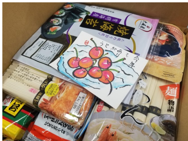
・支援先に送る準備中の食材箱。お米やこども向けのお菓子も入ります。

支援を必要とするご家庭からの申込みに応じ、1月1回1箱×3か月の無償送付を行っています。昨年は月25件ほどの申込であったのが、今年は月60件ほどになり、コロナ禍でじわじわと生活が厳しくなっているご家庭が増えています。お困りの方は船橋市「保健と福祉の総合相談窓口」さーくる（電話：047-495-7111）までご相談ください。